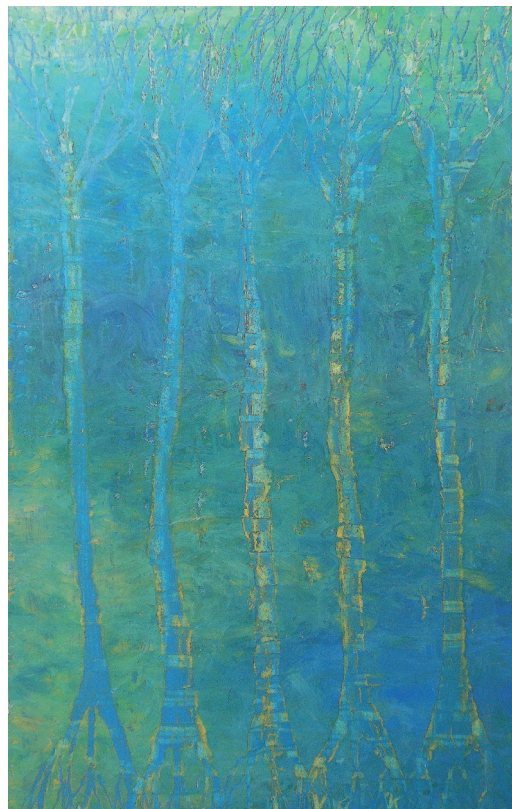
© Rose Pwin (Extraits: Phylum système racinaire #001 et #007)