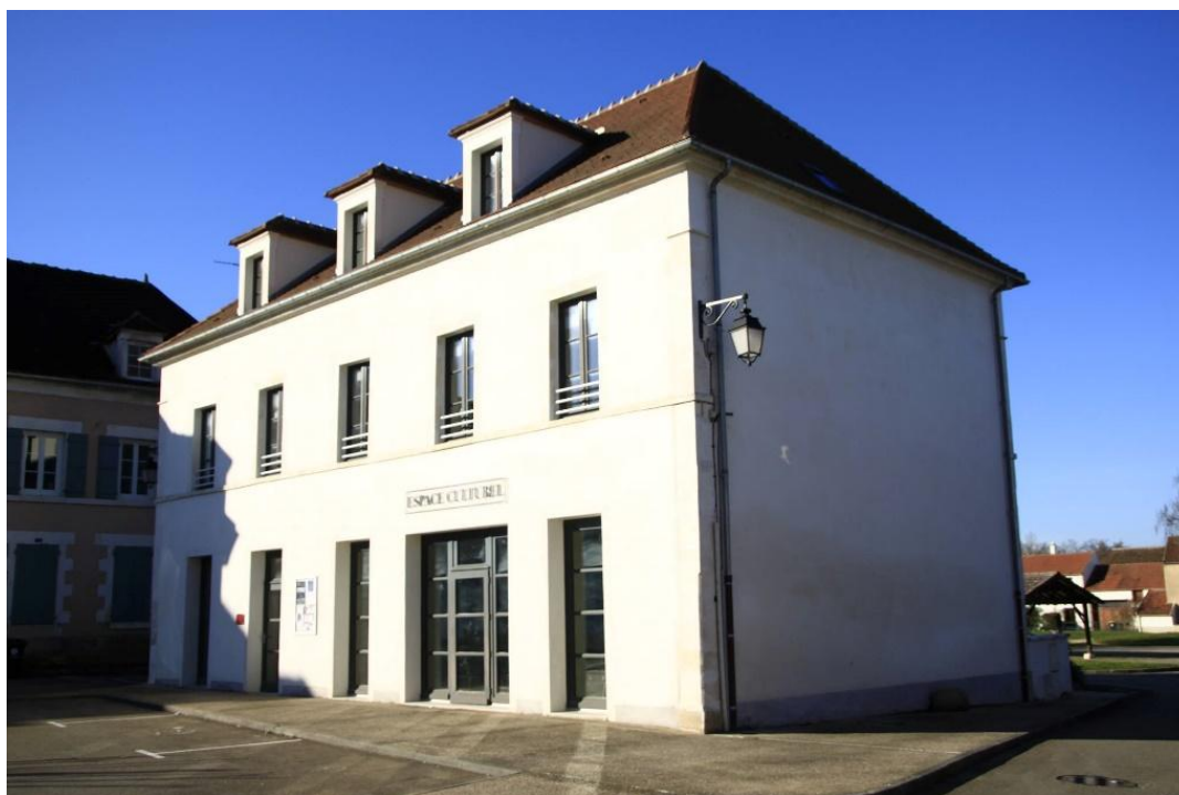
Le bâtiment de l'Espace culturel

Depuis 2017, la commune accueille des artistes en résidence à l'Espace culturel. En 2026, la municipalité souhaite enrichir son programme culturel par un projet de résidence d'artiste « Hors les murs », visant la création d'une œuvre pérenne dans l'espace public.