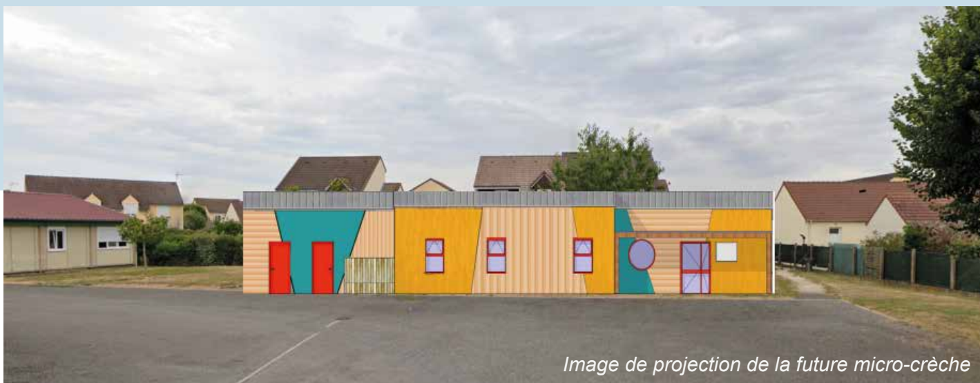
Image de projection de la future micro-crèche