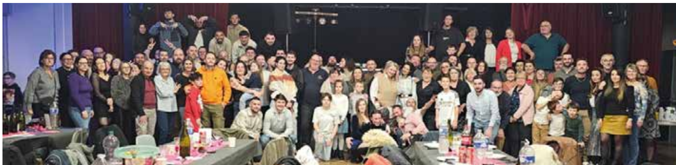
Soirée du foot le samedi 24 janvier à la salle des fêtes.

Plus d'info le mercredi après-midi au stade de foot ou au 06.27.91.62.69.